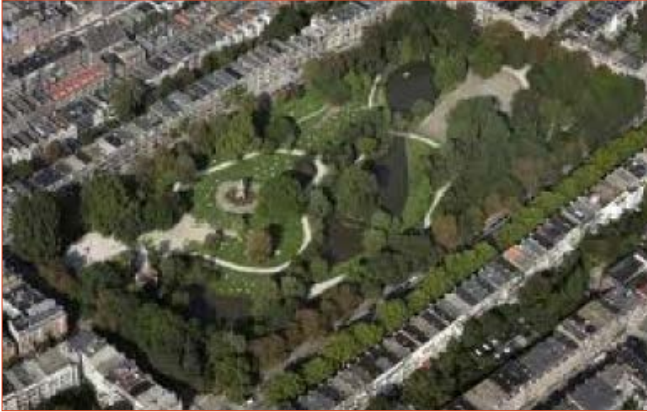
Het Sarphatipark is een voorbeeld van een groen hart in een stedelijk gebied