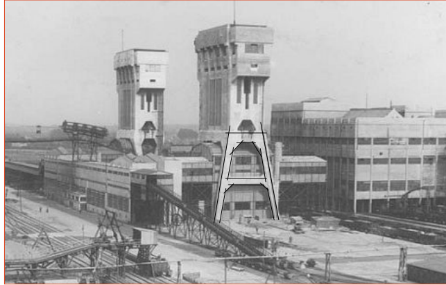
De inspiratie van de stadshal zijn de robuuste vormen van de schachten van Staatsmijn Maurits