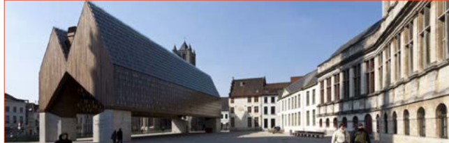
De stadshal structureert de openbare ruimte en biedt een dak voor multifunctionele activiteiten