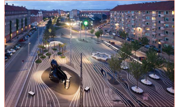
De stenen van het plein worden hergebruikt, maar nu in een patroon die de loop van het water verraad