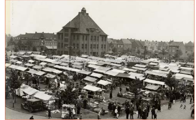
Al eeuwen vormt de markt het levendige hart van Geleen. Deze krijgt een duidelijke plek