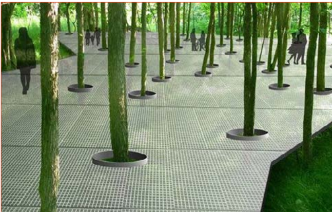
Om de strooissellaag te beschermen en voor eventuele waterberging liggen de paden iets verhoogd