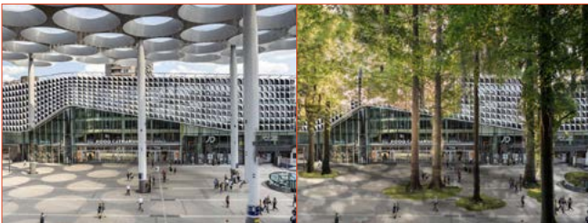
Het verschil in beleving...

Een goed vormgegeven openbare ruimte is een plek voor sociale interactie en heeft grote invloed op het welzijn van de mens. Ook Geleen verdient een karaktervolle ontmoetingsplek. Door op subtiele wijze terug te refereren naar het verleden, voort te bouwen op wat de huidige stedelijke structuur ons biedt, en ingrepen te doen op specifiek gekozen plekken worden de pleinen van Geleen weer geactiveerd. Bij de activatie van de pleinen ligt de focus op het welzijn van de mens en is de introductie van groen het belangrijkste middel. Drie pleinen die elk een eigen karakter kennen, die betrokkenheid en nieuwsgierigheid van de omgeving op verschillende schaalniveaus aanwakken, en het centrum van Geleen nieuw leven inblazen.