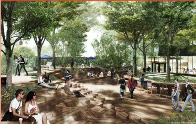
In het bosplein zelf is ruimte voor ontmoeten, spelen, theater en tot rust komen