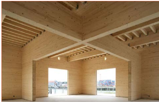
De markthal heeft een juiste verhouding met het plein waaronder multifunctionele activiteiten mogelijk zijn (bron: Wim Goes Architectuur)