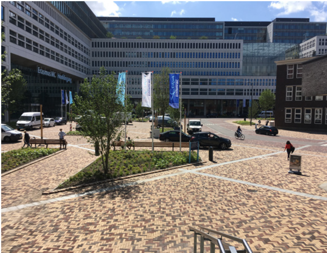
Door auto gedomineerde plekken worden in het shared space concept fiets en voetganger vriendelijk bron: Dr. Molenwaterplein, Rotterdam, Juurlink [+] Geluk