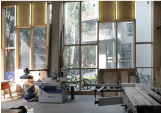
Sommige faciliteiten worden gedeeld zoals vergaderruimtes en “maakplekken” bron: Spreefeld, Berlijn, BAR Architecten