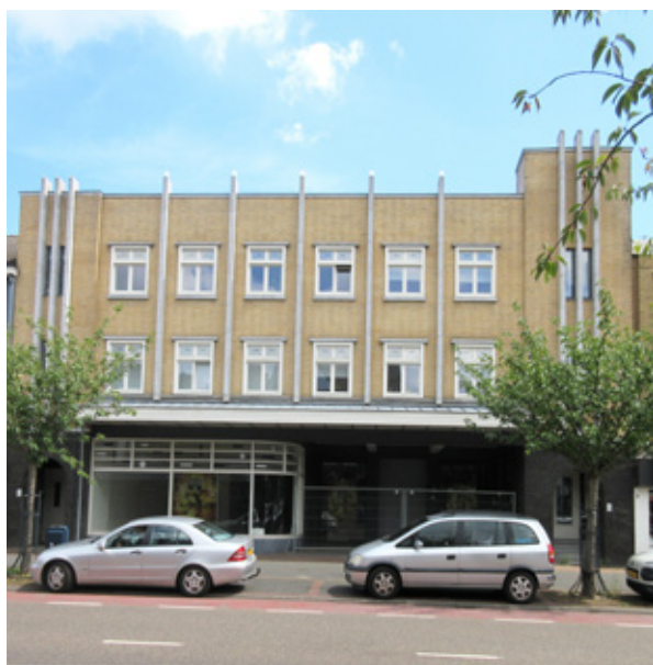
De Roxy krijgt de kans een centrale rol te spelen in deze herinrichting van de Rijksweg