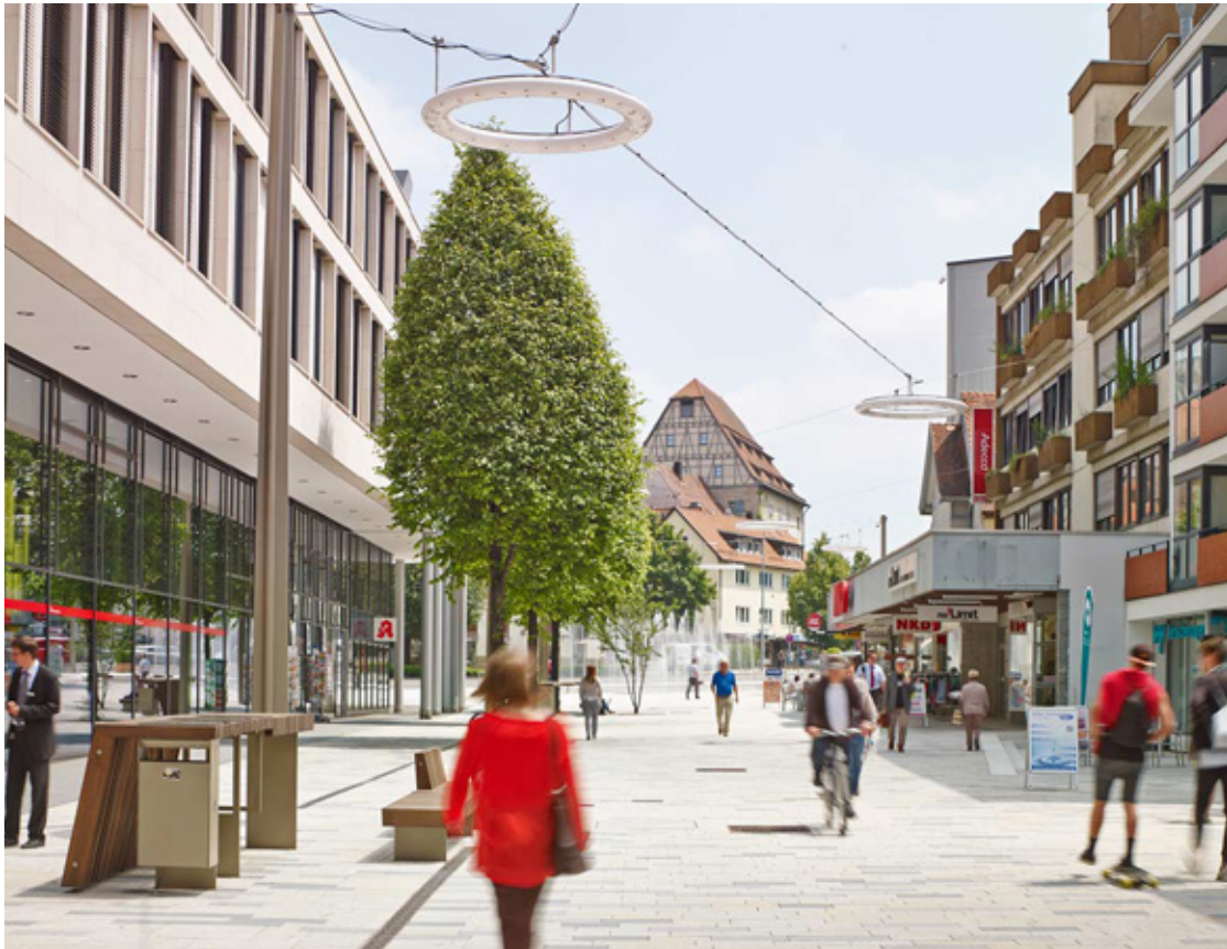
Door de Rijksweg shared space te maken krijgt Geleen een nieuw en fris gezicht