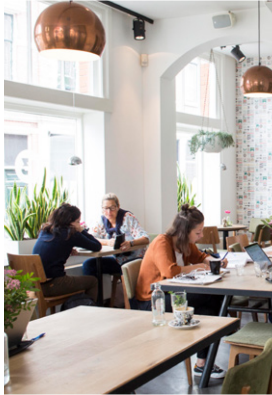
De focus van het centrum verschuift en dagelijkse activiteiten zoals flexwerk vullen de leegstand in